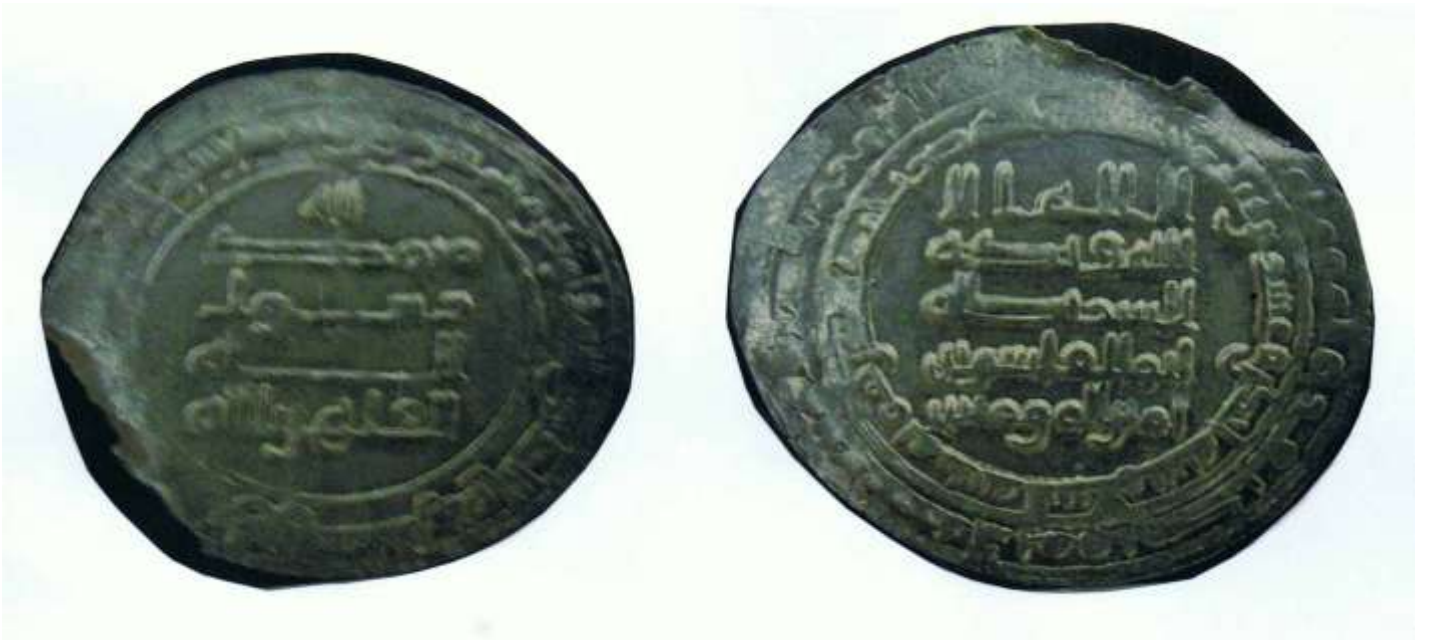
شكل رقم (٢) (٦٦٦٨ - مس)