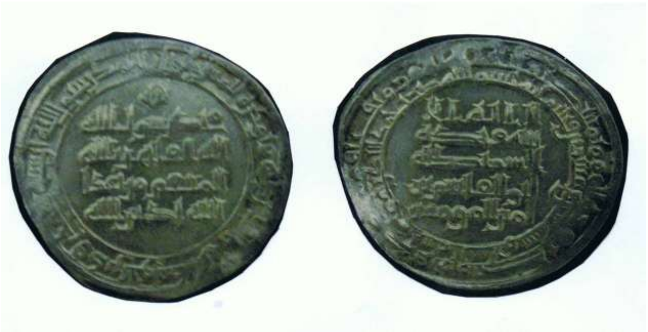
شكل رقم (٢) (٦٦٦٩ - مس)