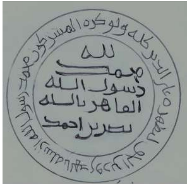
رسم توضيحي للرقم ( ٦٦٧٤ - مس ) للخليفة المحفوظة في المتحف العراقي ، ظهر عليه اسم ( نصر بن احمد ) عامل الخلافة