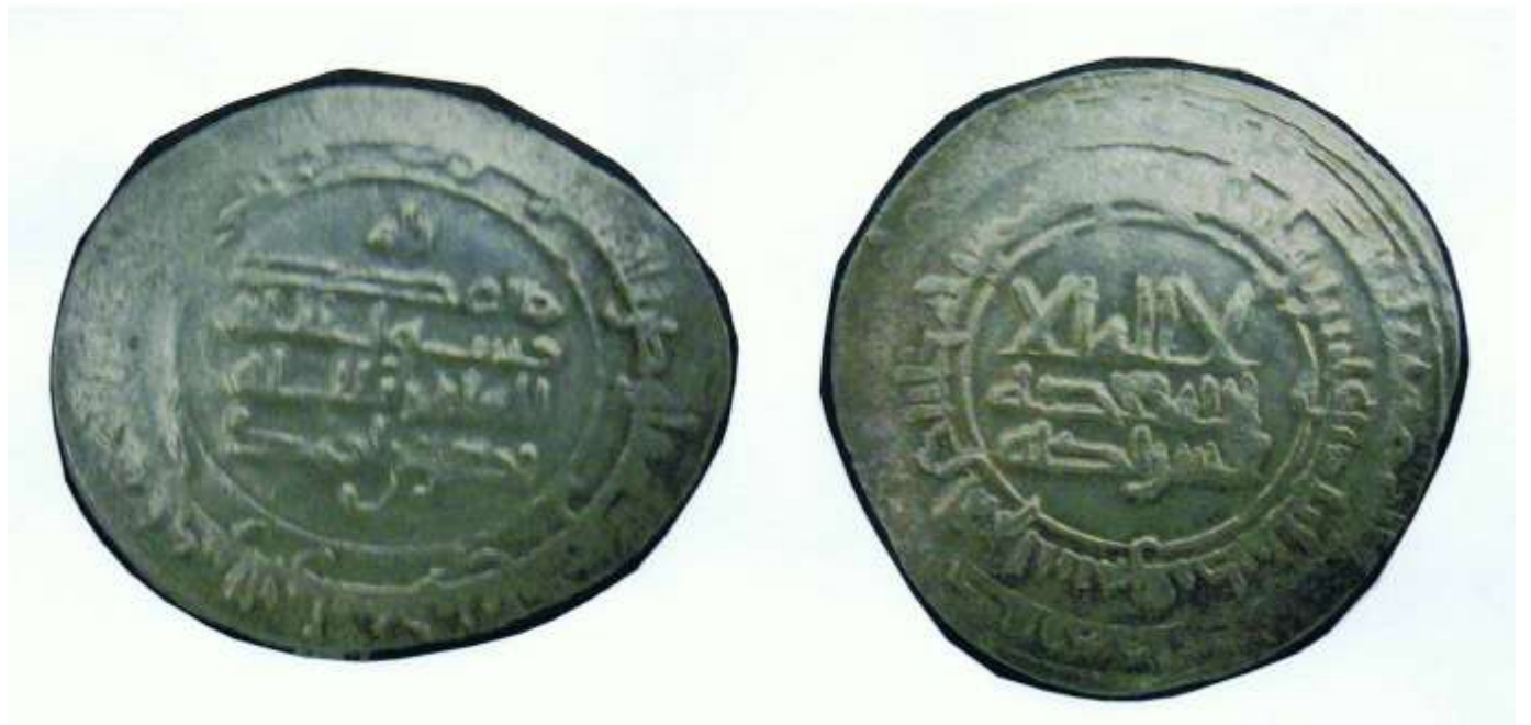
شكل رقم (٢) (٦٦٧٤ - مس)