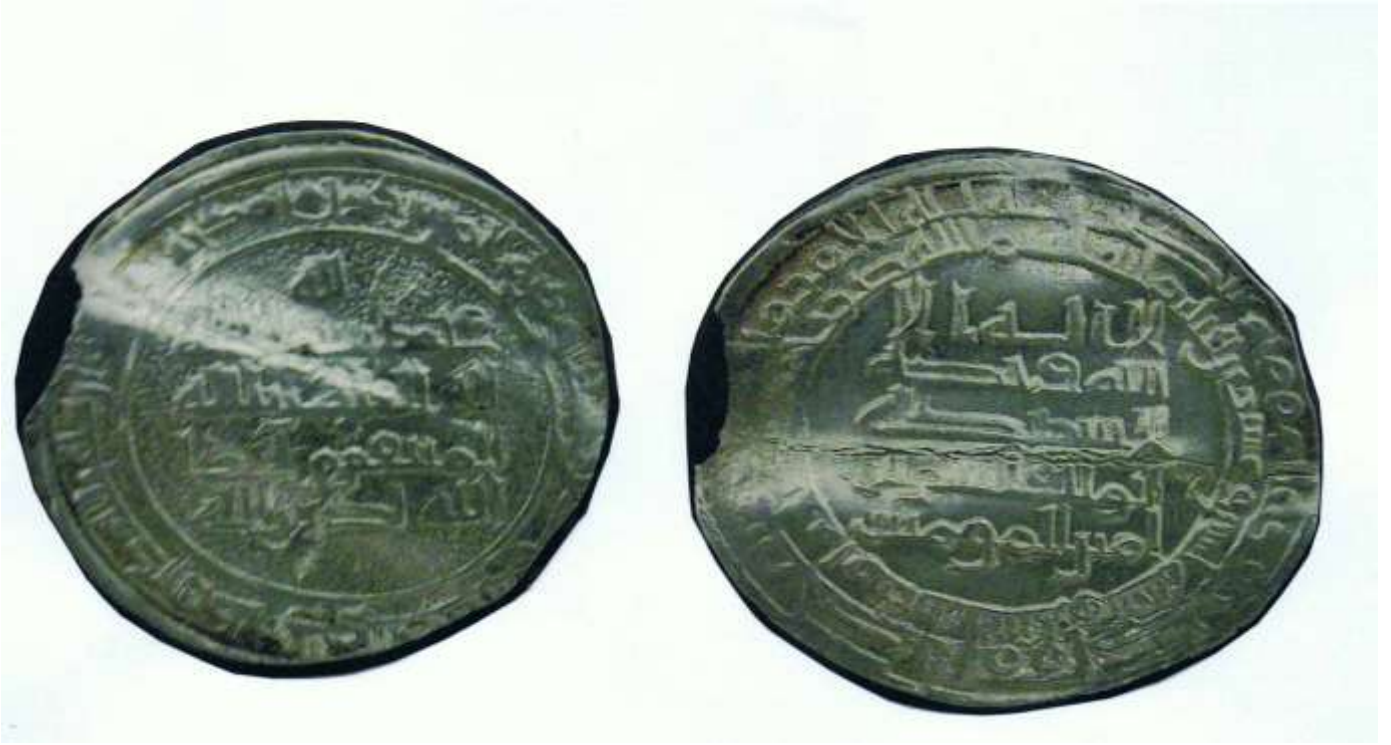
شكل رقم (١) (٦٦٧٠ - مس)