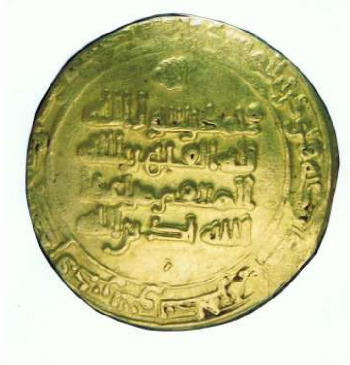
إحدى دنانير الخليفة القاهر بالله المحفوظة في المتحف العراقي ، يظهر عليه لقبه ( المنتقم من أعداء الله لدين الله )