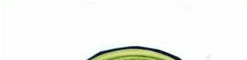
لوحة رقم ( ٢ )