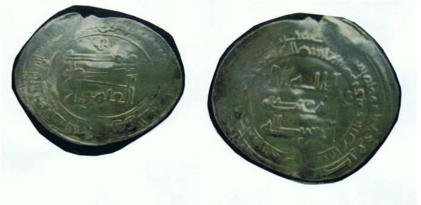
شكل رقم (١) (٦٦٧٥ - مس)